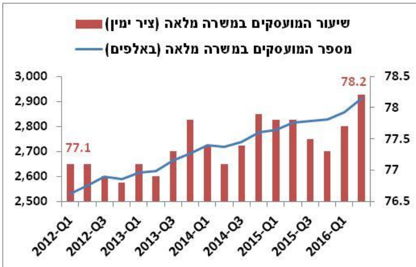
תרשים 2 – מספר המועסקים במשרה מלאה ושיעורם מכלל המועסקים בגילאי 15+

בנוסף, קצב עליית השכר הממוצע מעיד כי המשק מתקרב לתעסוקה מלאה. ב-12 החודשים שהסתיימו באפריל, השכר הממוצע במשק צמח בשיעור ריאלי של 3.3%.